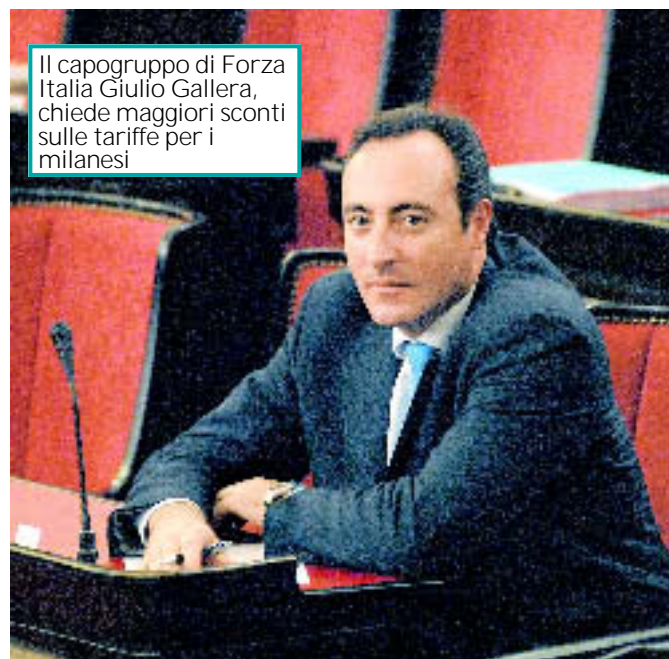
Il capogruppo di Forza Italia Giulio Gallera, chiede maggiori sconti sulle tariffe per i milanesi