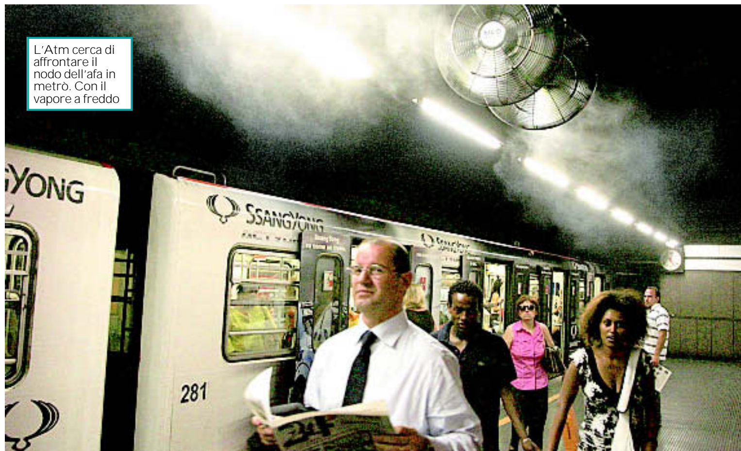
L'Atm cerca di affrontare il nodo dell'afa in metrò. Con il vapore a freddo

PIÙ CHE RADDOPPIATE IN 7 GIORNI LE CHIAMATE