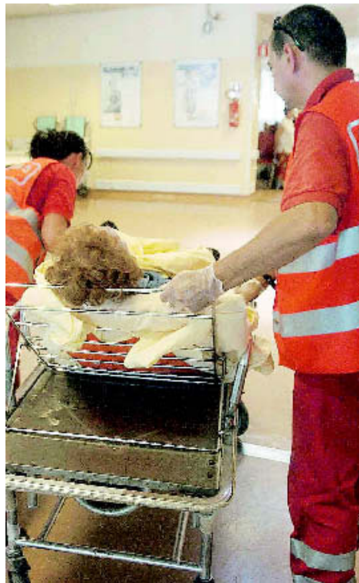
A causa del caldo, ieri sono aumentate vertiginosamente le chiamate al numero verde 800.777.888 messo a disposizione dal Comune per i cittadini più a rischio. Due persone sono morte

Ieri in città si sono registrati anche due decessi per malore. Sem-