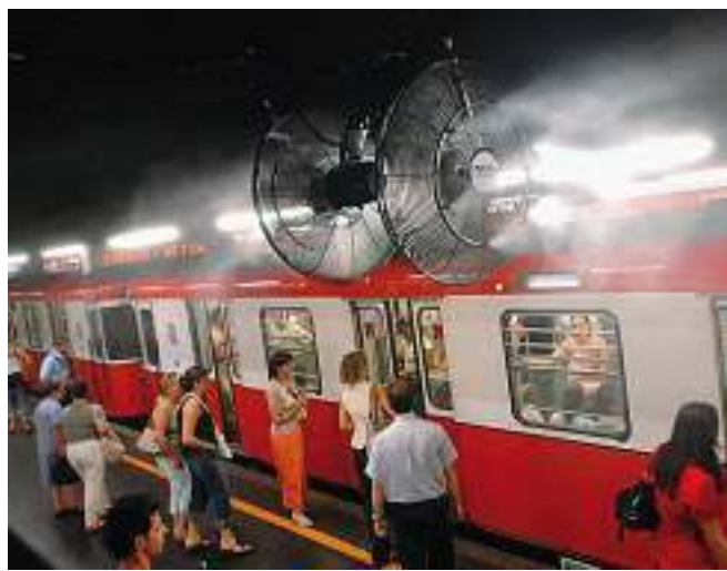
Refrigerio A sinistra, vaporizzatori d'acqua in un locale del centro e in metropolitana. A destra, milanesi a caccia di refrigerio in una fontana. Il termometro non scende sotto i 35° da oltre una settimana. Così fino a domenica